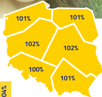
Plonowanie odmiany RUSAŁKA (% wzorca) w poszczególnych rejonach (COBORU 2016/2017)